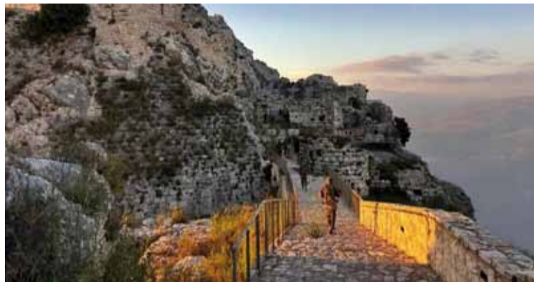
Ofensiva. Israel anunció ayer la ocupación del castillo de Beaufort.

El castillo de Beaufort ya había sido ocupado por Israel durante la invasión de 1982 y permaneció