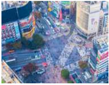
El cruce de Shibuya.

Japón se convirtió en un destino elegido por los argentinos en el último año: en 2025 viajaron 33.838 argentinos, un récord histórico que supera ampliamente los niveles prepandemia.