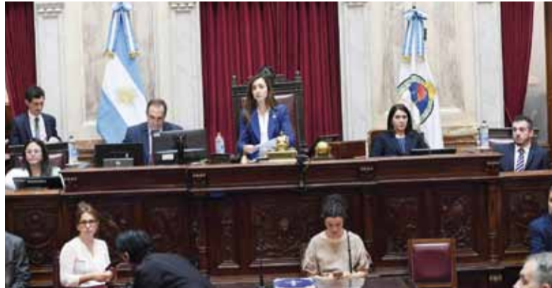
Cámara alta. El oficialismo busca acuerdos para sesionar este jueves.

Por ese motivo, el temario definitivo de la sesión será motivo de intensas negociaciones y se terminará de definir en la reunión de Labor Parlamentaria del miércoles, según admitieron fuentes parlamentarias. Los opositores respaldan el pedido del Gobierno para pagar a dos fondos buitres y el dictamen sobre “inviolabilidad de propiedad privada”,