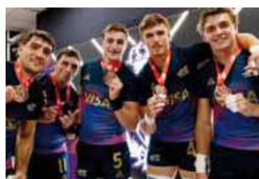
Presea. "Pumas" felices en España.

La medalla obtenida en Valladolid significó la número 56 para "Los Pumas" 7s en el Circuito Mundial: 12 de oro, 19 de plata y 25 de bronce. Asimismo, el equipo se mantuvo en el segundo puesto de la clasificación general con 34 puntos,