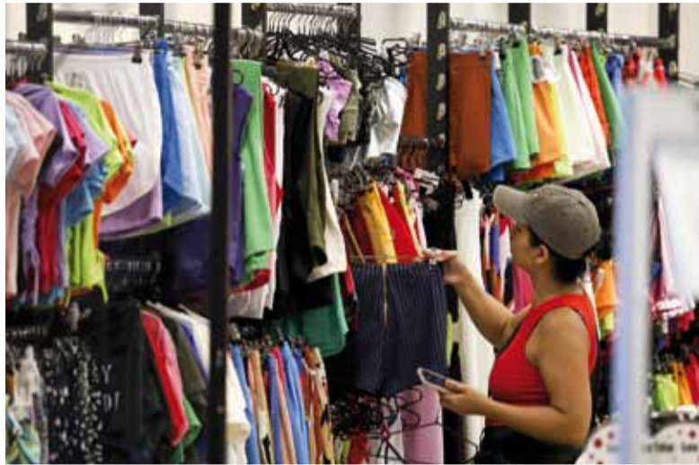
Advertencia. Según CAME, las reformas “recaen principalmente sobre los asalariados y el consumo doméstico”.

Para CAME, el FMI ignora en su diagnóstico el nivel de tributación subnacional, señalando que “es donde reside el nudo fiscal más dañino para la actividad económica: el Impuesto sobre los Ingresos Brutos y las tasas retributivas de servicios municipales”.