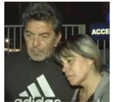
Los abuelos de Agostina, tras su reunión con el Gobernador.

"Quiere saber más información y no se la queremos dar. El equi-