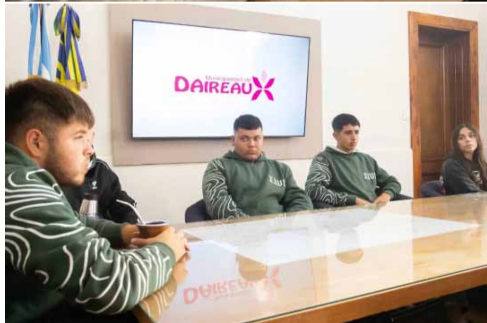
Imagen de la reunión de la intendente con los alumnos de la Secundaria N° 6.